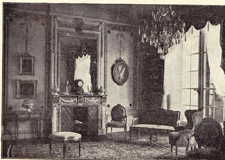
Exposition à l'Art ancien, à Liège. — Salon Louis XVI.